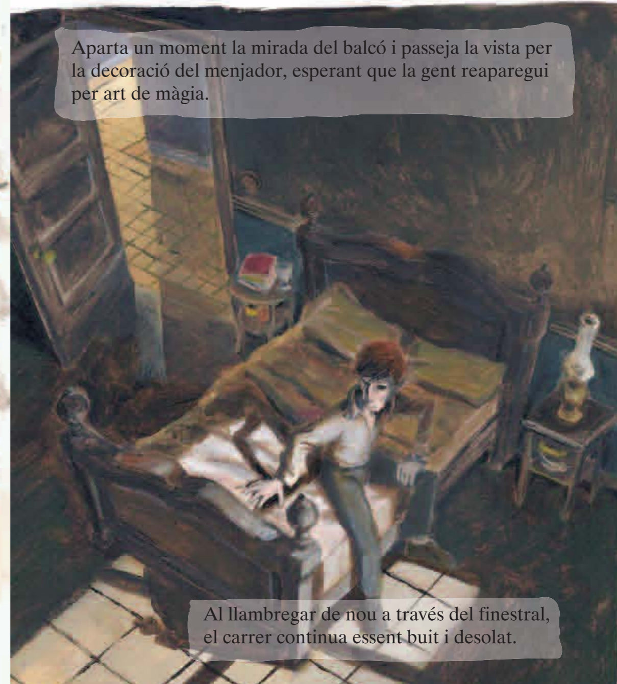
Aparta un moment la mirada del balcó i passeja la vista per la decoració del menjador, esperant que la gent reaparegui per art de màgia.