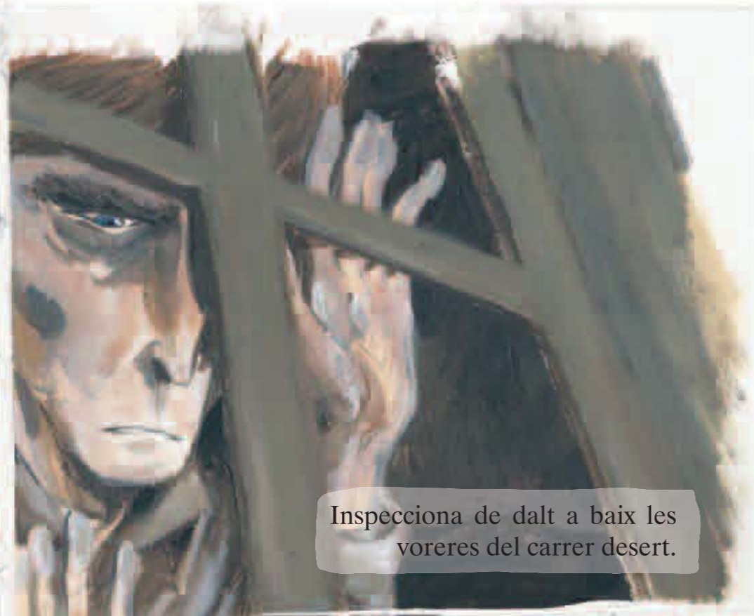
Inspecciona de dalt a baix les voreres del carrer desert.