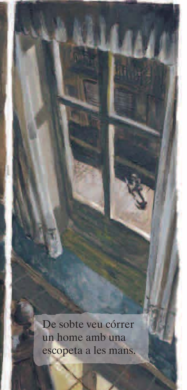
De sobte veu córrer un home amb una escopeta a les mans.