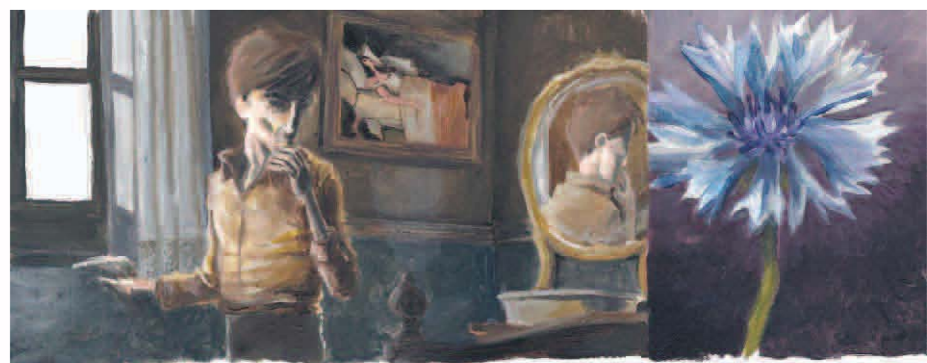
S'inquieta més que de costum. La situació el molesta i voldria veure persones caminant, xerrant o cridant per recordar-li que està en el món real.